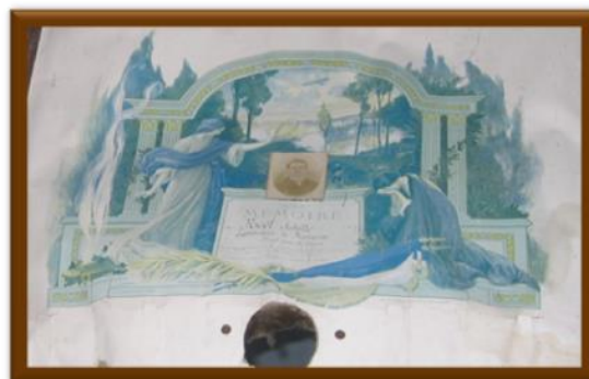
Cadre en hommage à Achille Noël, retrouvé dans les archives de l'école de Planques.