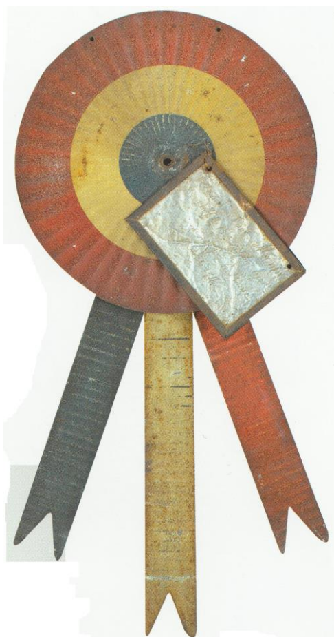
Cocarde métallique apposée sur la tombe d'un Mort Pour La France.

Inhumé à Villers-aux-Bois, dans le cimetière militaire, sa tombe est transférée le 3 juillet 1923 à Ablain-Saint-Nazaire, tombe 66 126, dans le cimetière national de Notre-Dame-de-Lorette.