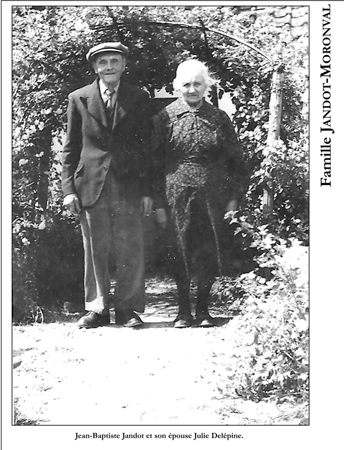
Photo présentée dans la revue 17 Visages de Poilus de La Petite Histoire de Fressin (page 223).