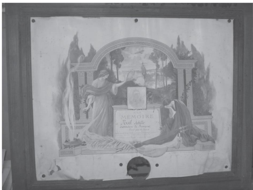
« MEMOIRE à Noël Achille Instituteur à Planques Mort pour la France ».

Parmi eux, Achille Noël : né le 22 janvier 1886, à Roubaix, il est arrivé à Planques le 4 janvier 1912. Il a cessé ses fonctions le 4 août 1914. Mobilisé, il est mort pour la France le 14 septembre 1914. Nous avons retrouvé sa photo sur un tableau posé dans un coin de l'ancienne école.