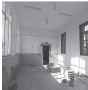
Ouverture sur l'extérieur