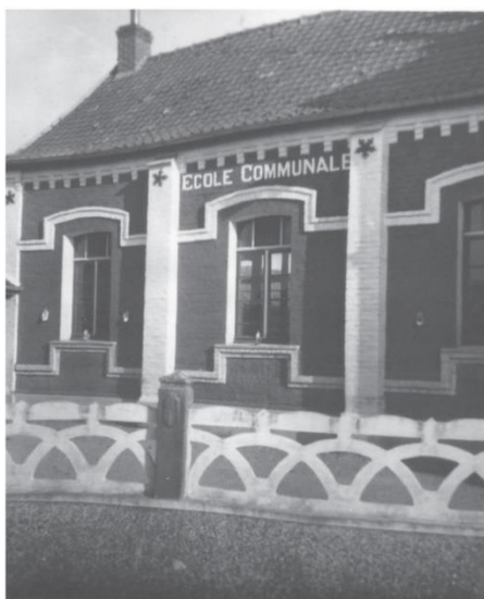
La classe de l'école

Le bâtiment sera constitué d'une partie logement pour l'instituteur , de la classe et comme l'instituteur fait souvent office de secrétaire de mairie , d'un bureau consacré au Maire pour traiter les affaires communales.