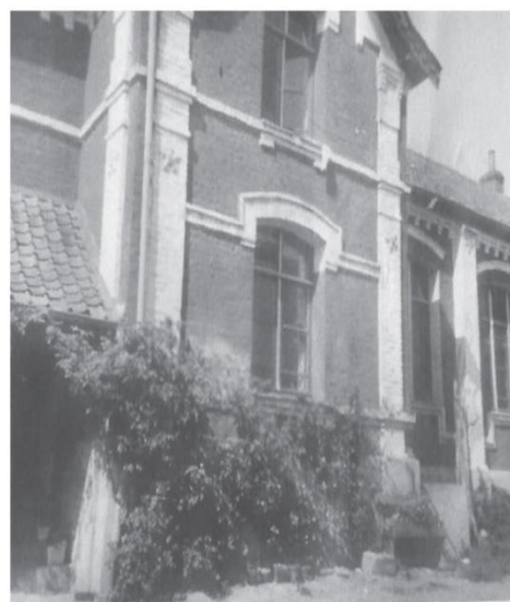
L'arrière du bâtiment