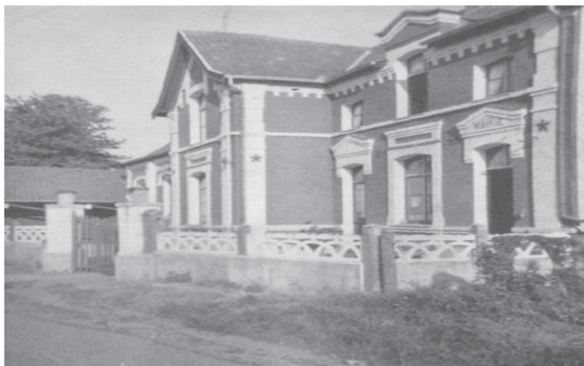
Le logement et la Mairie